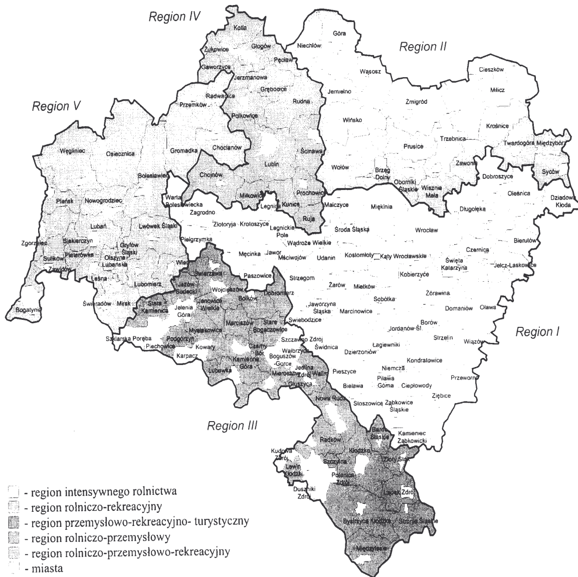
Rys. 1. Regiony funkcjonalne obszarów wiejskich Dolnego Śląska